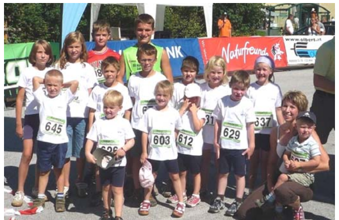
Die Teilnehmer der WSG am Weyer Kinderlauf