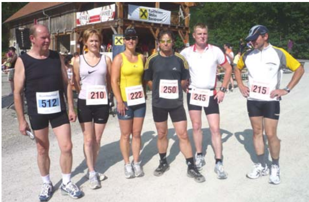
Die Teilnehmer der Laufgruppe der WSG am Brunnbachlauf