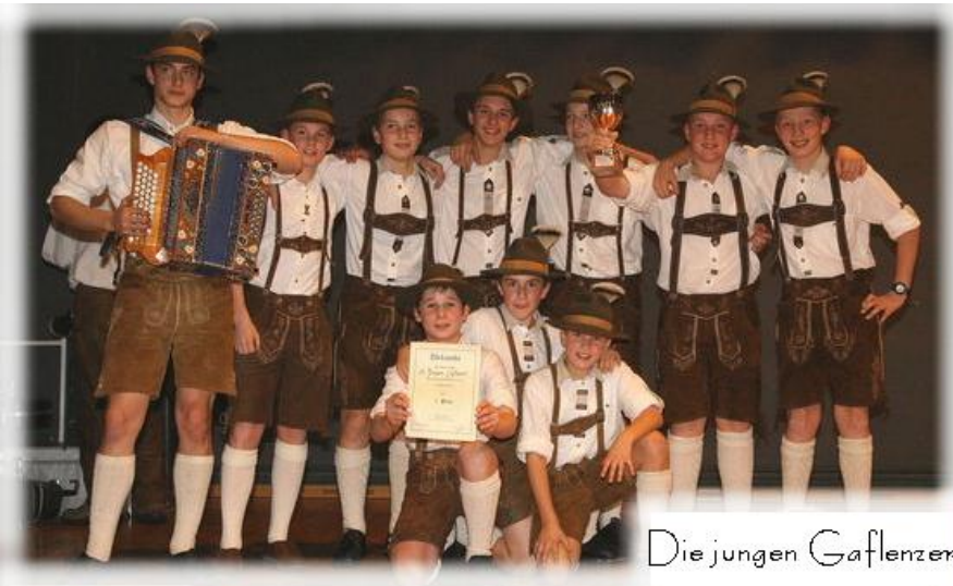
Die jungen Gaflenzler