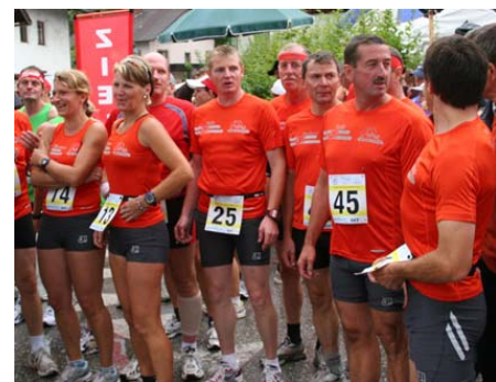
Zahlreiche WSG- Läufer waren mit am Start.