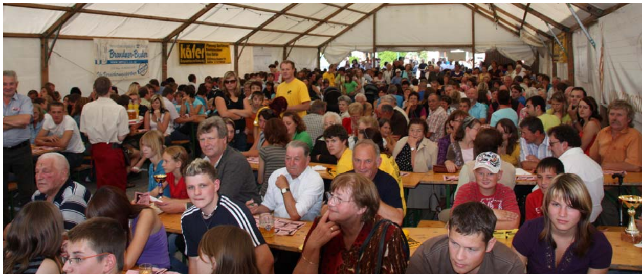
Das Zelt der Trachtenmusikkapelle war bis auf den letzten Platz gefüllt.