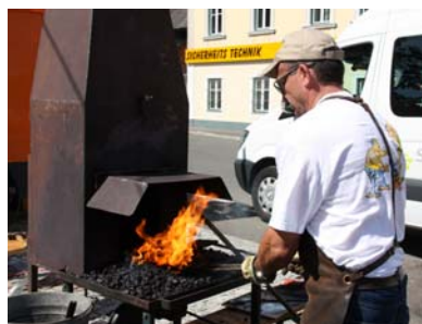
Schmied aus der Partnergemeinde Clemency