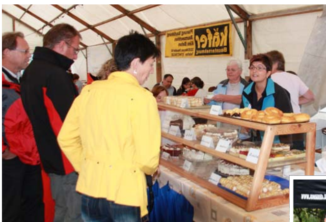
Die Goldhaubengruppe verwöhnte mit Kaffee und herrlichen Mehlspeisen.