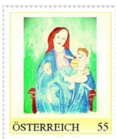
Entwurf und Zeichnung: Reinhard Wagner