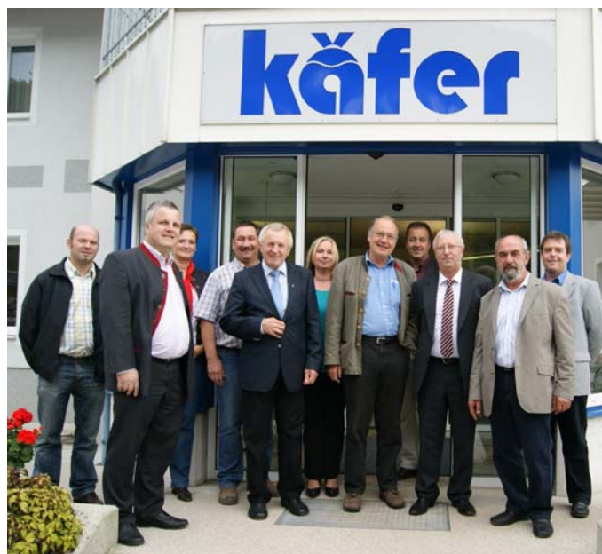
Die Firmen Filzwieser und Käfer wurden besichtigt.